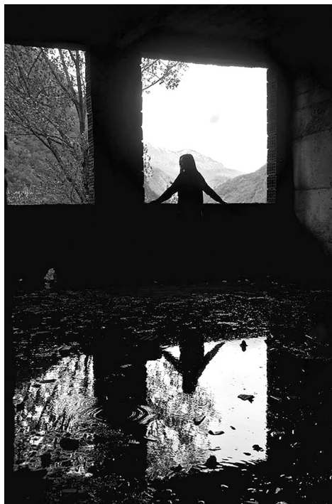
Jedna od fotografija koju su napravile učenice Obrazovnog centra u Šavniku, tokom radionice umjetničke fotografije u okviru projekta „Artivacija mladih, sjever-sjeverozapad“, koju je naša partnerska NVO TNT realizovala u Žabljaku, Plužinama i Šavniku, 2018. godine.