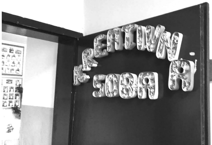
Kreativna soba u Osnovnoj školi Vladimir Nazor u Podgorici, u kojoj se odvijaju različite aktivnosti učenika.