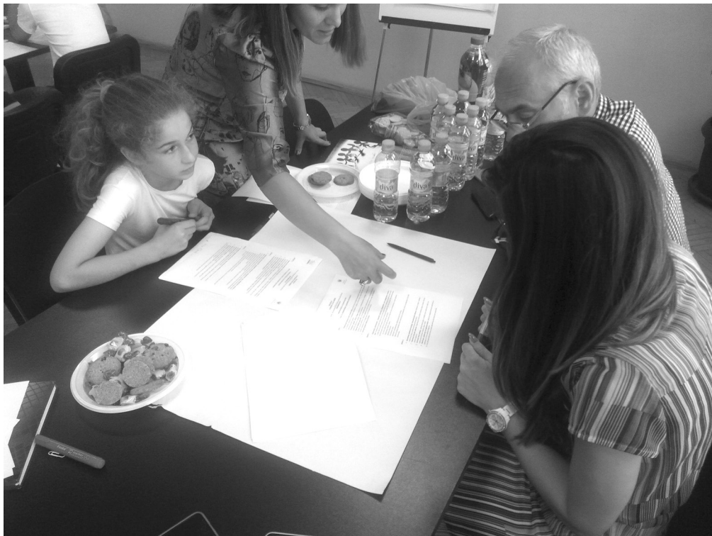
Timski rad u OŠ. Vladimir Nazor u Podgorici tokom projekta „Korisnik je na mreži“ učenica, roditelj, pomoćnik direktora i predstavnik NVO KUČA.